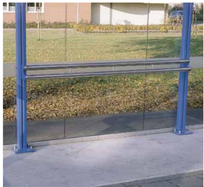
Ausführung mit Aluminium-Anlehnbügel