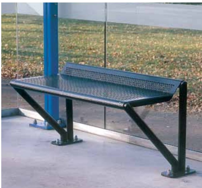
Ausführung mit Sitzbank

eMail johannes@teeken.de Internet www.teeken.de