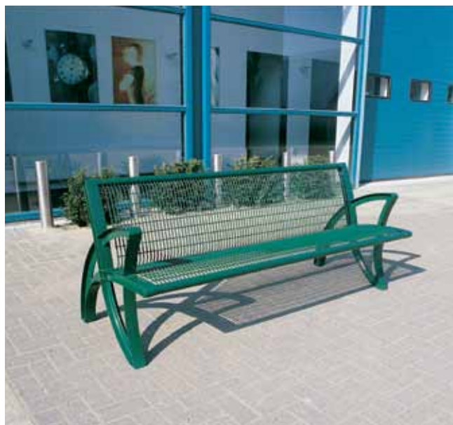
Lotus mit Stahlgittersitz und -rückenlehne