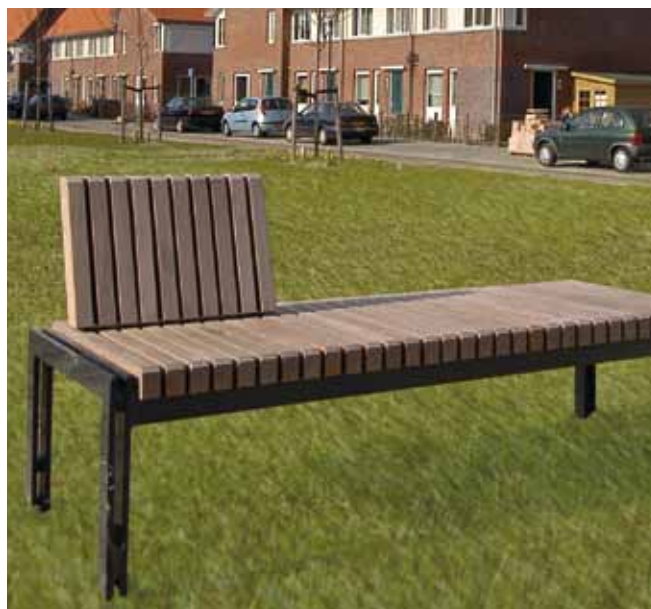
Sitzbank München mit 1 Rückenlehne