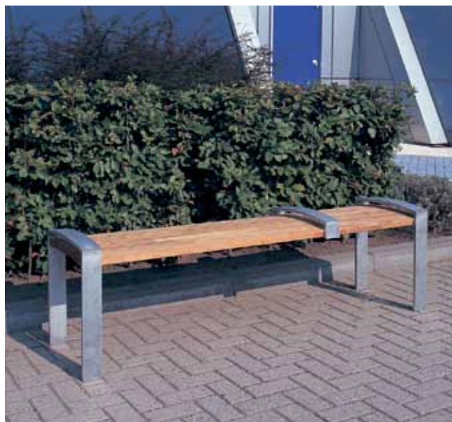
3-Sitzer ohne Rückenlehne