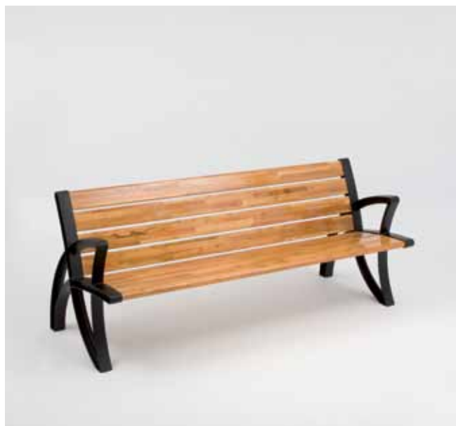
Lotus mit Sitz und Rückenlehne aus Holz